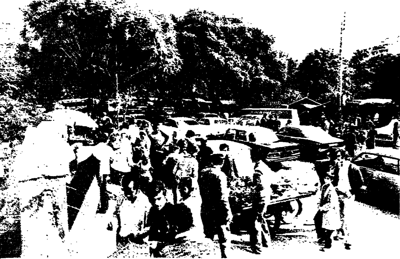
جانب من السوق الشعبية في الصناع